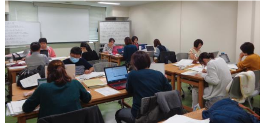
＜グループワークの様子＞