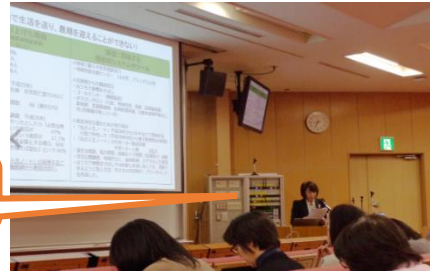
＜成果発表会の様子＞